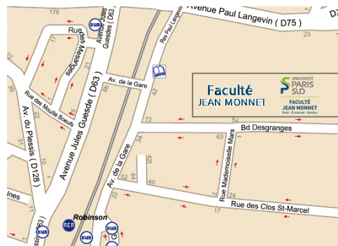
Plan de la Faculté Jean Monnet – Salle Vedel (bâtiment G)

RER B, Station Robinson, descendre l'avenue de la Gare, puis prendre à droite, boulevard Desgranges.